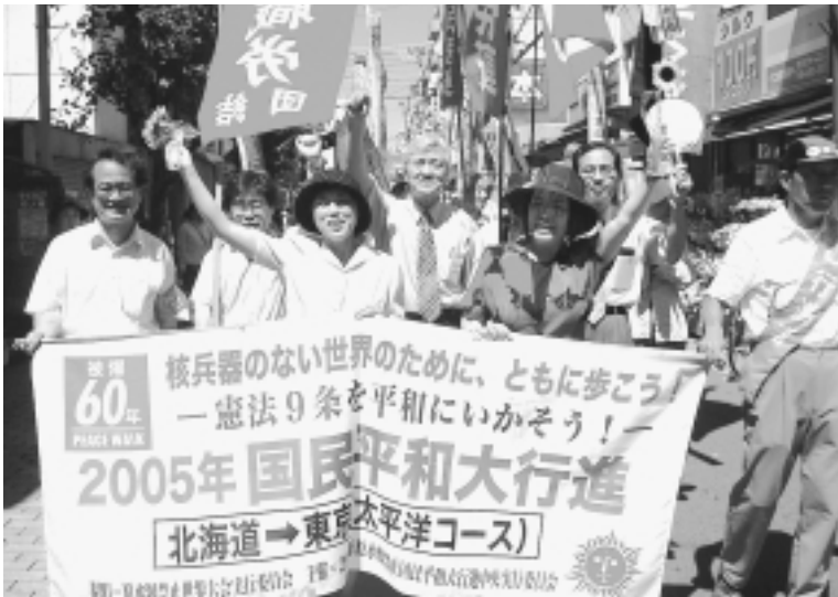
「核兵器をなくせ」と足立区内をすすむ平和行進 (7月27日)

また、障害者のくらしを脅かす大幅な負担を強いる障害者「自立支援」法案の撤回を国に求めるよう強く要請しました。