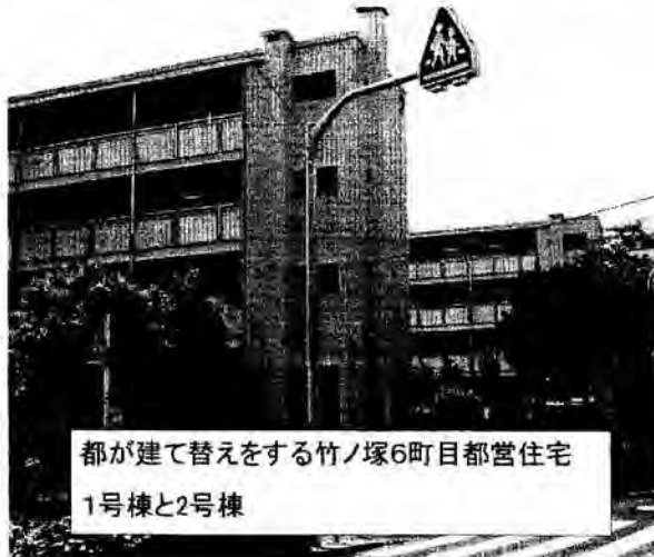
都が建て替えをする竹ノ塚6町目都営住宅

自宅・花畑6-7-23 電話3859-5952 足立区役所・電話3880-5111(内線4650~4654) 日本共産党議員団・ダイヤル直通・3880-5770~1