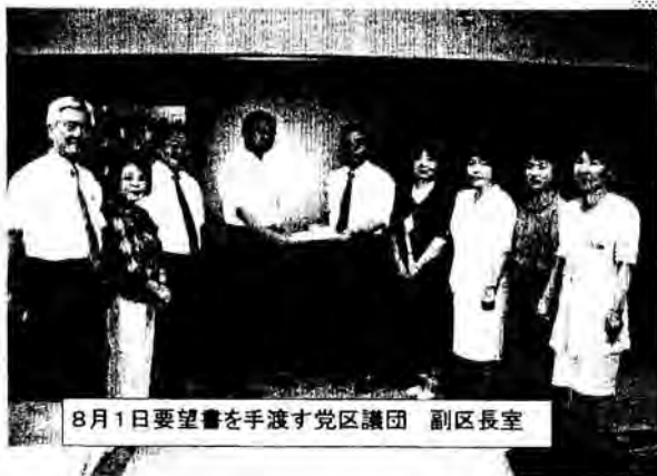
8月1日要望書を手渡す党区議団 副区長室

私は委員会で「新たな融資」について質疑。区は、「新たな融資」は原油高騰で苦しむ中小企業が借りや