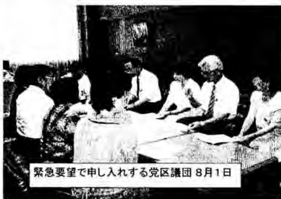
緊急要望で申し入れする党区議団 8月1日

すく、返済期間は長く、他の金利の高い融資の借り換えなども可能とする方向を示唆し、実施に向け「補正予算を組む」ことを明らかにしました。