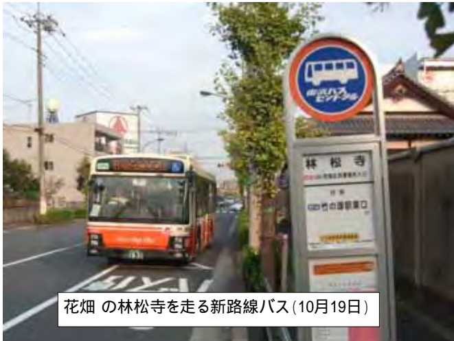
花畑の林松寺を走る新路線バス(10月19日)

すでに伊藤ニュースでお知らせした(八月三十一日付け、NO・811号)花畑団地く竹ノ塚駅東口のバス路線「竹16」が十月十一日に新設・運行されました。花畑団地から花畑1丁目の林松寺、花畑区民事務所入口、西保木間2丁目、竹の塚7丁目などを経由する竹ノ塚駅東口までのバス路線が実現して、住民の方から「本当に良かった」「便利になった」と声が届いています。