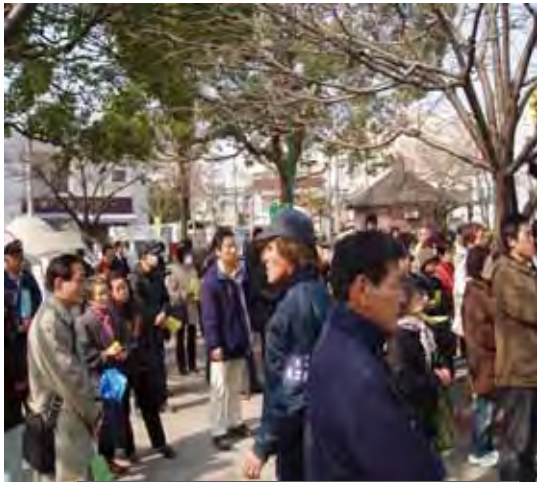
今年の重税反対集会 千住旭公園にて

しかし区民の貯金は 減る一方です。増税な どでためこんでいる基 金の一部を取り崩して 区民の生活を支える、 業者を支援すること、 介護保険料の値上げを ストップすることは十 分可能です。日本共産 党は景気悪化から区民 のくらしをまもるため がんばります。