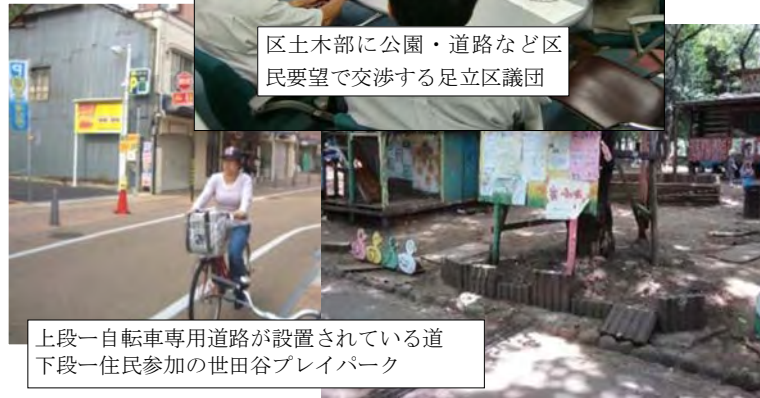
上段一自転車専用道路が設置されている 下段一住民参加の世田谷プレイパーク