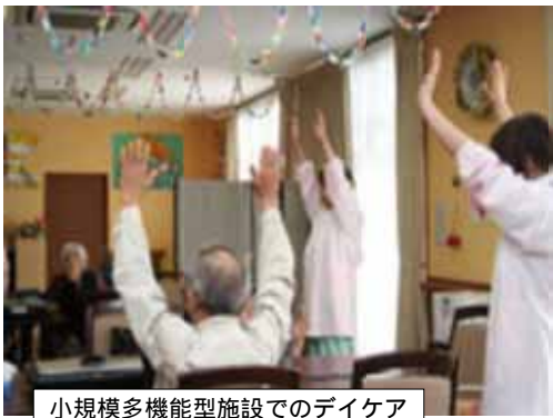
小規模多機能型施設でのデイケア

10月26日、介護保険課は国の介護基盤の緊急整備特別対策をうけて、小規模多機能型居宅介護サービスの整備目標を上乘せし、第4期(21~23年度)整備目標を10ヶ所から12ヶ所に増やしていくことを明らかにしました。