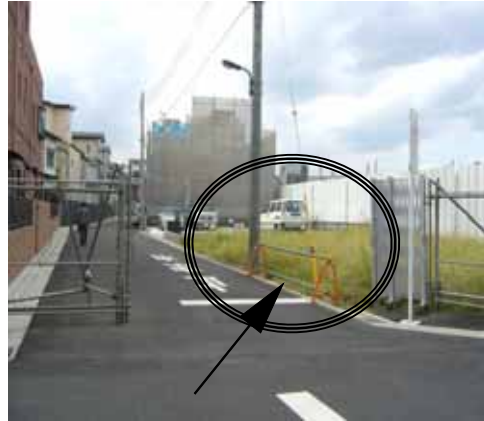
草が伸びだしている保育園予定地(旭町)

用地を貸与する形で進められていますが、規定の地代に加え権利金、保証金が2000万円以上もかかることが分かりました。