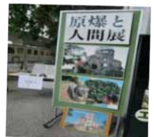
今年も8月3日から6日まで足立区役所内で開催されました