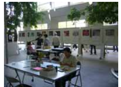
足立区原爆被害者の会が主催した「原爆・平和・戦争を考える展示会」