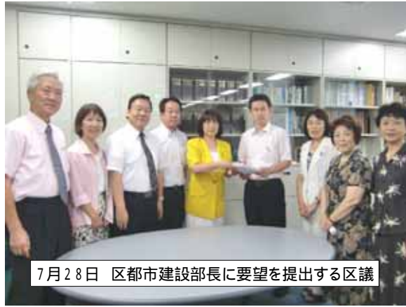
7月28日 区都市建設部長に要望を提出する区議

氏名の記入がない方も多く、直接ご返事をする事ができませんが、区や警察など関係各機関から回答を得るとともに早急に改善を申し入れました。