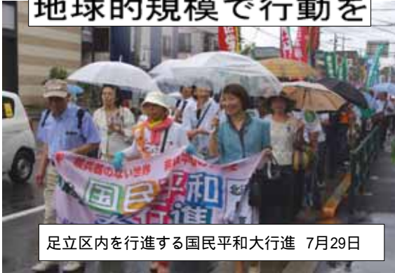
足立区内を行進する国民平和行進 7月29日