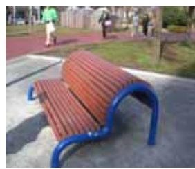
背のばしベンチは滑って地面に落ちなくなりました。下の写真は新しいベンチ

東保木間の総合スポーツセンターでウォーキングを楽しんでいる住民から「体操器具が使いにくい」「ベンチがない」の声が寄せられていましたが、このほど器具を入れ替え、新たにベンチが設置され改善しました。