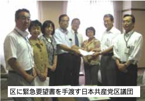
区に緊急要望書を手渡す日本共産党区議団