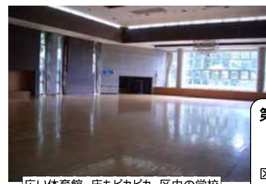
広い体育館。床もピカピカ。区内の学校体育館よりかなり立派なものです。