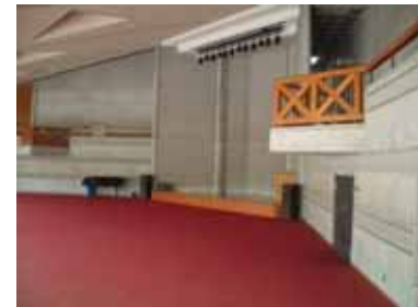
講堂もかなり豪華なつくり