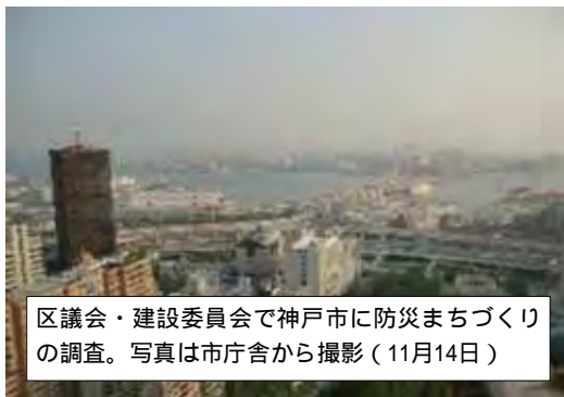
区議会・建設委員会で神戸市に防災まちづくりの調査。写真は市庁舎から撮影(11月14日)