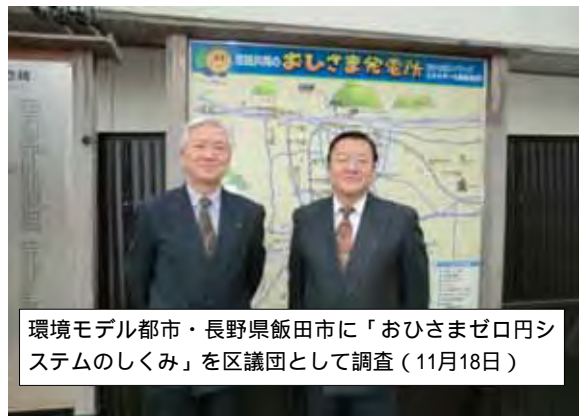
環境モデル都市・長野県飯田市に「おひさまゼロ円システムのしくみ」を区議団として調査(11月18日)

来年4月入園認可保育園旧児募集 保育園は「認可」保育園か「認可外」保育園しかありません。他区では認可保育園を作って待機児解消にあたっていますが、足立区では認可外の保育園しか作りません。児童福祉法に反する異常な姿勢です。「認可外」保育施設へ直接申し込み、保育料は定額制・高め、保育室面積や保育士配置基準は「認可」園よりゆるやか)は「安上がり保育」とも言われますが、保育現場では保育士たちががんばって質のよい保育を維持し子どもたちを守っています。