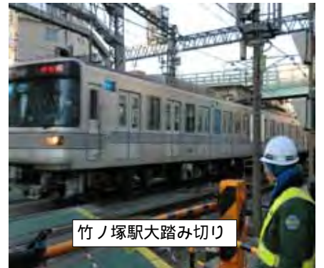
竹ノ塚駅大踏み切り

足立区は、3月30日に昨年12月20日に事業認可を取得した東武伊勢崎線(竹ノ塚駅付近)連続立体交差事業について、費用負担や施行区分等を取り決める施行協定を東武鉄道と締結しました。