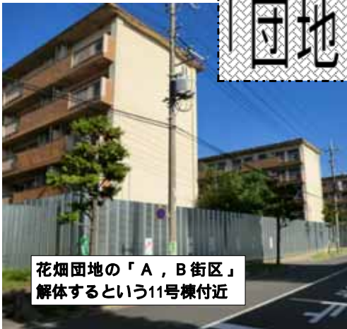
花畑団地の「A, B街区」 解体するという11号棟付近

UR花畑団地は、事業ブロック 継続ブロックに分けて「団地再生」計 画を進めています。が、団地西側の1 号棟から22号棟まで810戸を囲っ て解体するそうですが、壊すなんて もったいない。都営住宅に10数回も 申し込んで、当たらないで住まい に困っている人がたくさんいるのに 再活用すべきだ。(Aさん)