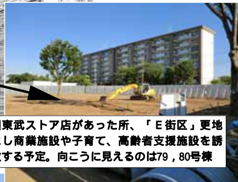
旧東武ストア店があった所、「E街区」更地 にし商業施設や子育て、高齢者支援施設を誘 致する予定。向こうに見えるのは79, 80号棟