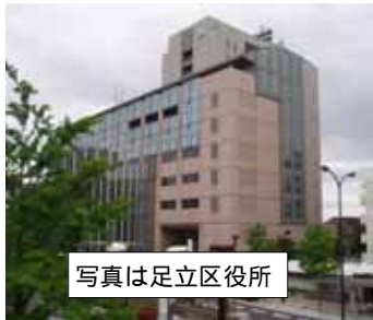
写真は足立区役所

8月31日の議会運営委員会に足立区 の2011年度決算(調書)が示され ました。 それによると歳 入(収入)総額は 2480億円で足 立区政史上過去最 高となりました。