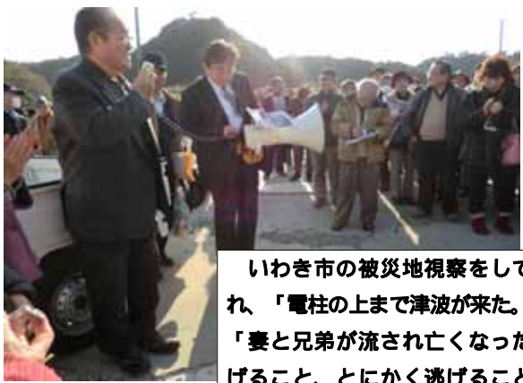
いわき市の被災地視察をしてきました。自分の家は流され、「電柱の上まで津波が来た。黒い津波が船だと思った!」「妻と兄弟が流され亡くなった、津波がきたらとにかく逃げる、とにかく逃げる」と地獄のような状況を話してくれた志賀区長さん・左上写真 涙が出ました。