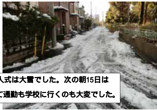
今年の成人式は大雪でした。次の朝15日は雪が凍って通勤も学校に行くのも大変でした。