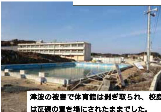
津波の被害で体育館は剥ぎ取られ、校庭には瓦礫の置き場にされたままでした。