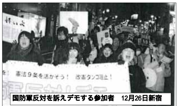
国防軍反対を訴えデモする参加者 12月26日新宿

貧困と格差が広がるなかより反動的な動きも強まり軽視できないマスコミ報道が続いています。最近、評判の映画を見ました。『レ・ミゼラブル』です。ピクトル・ユゴットの原作のミュージカルで迫力ある映像劇がすばらしく感動しました。19世紀パリ市民の蜂起は、歌によつて躍動感が迫りました。おすすめします。(伊藤和彦)