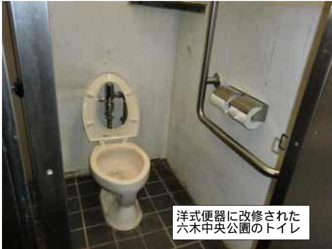
洋式便器に改修された六木中央公園のトイレ