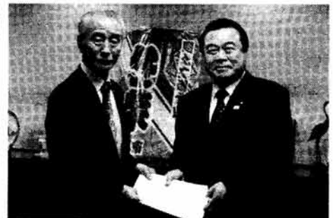
▲鈴木区長から冬柴大臣に要望書を提出

「竹ノ塚駅付近鉄道立体化」のお問い合わせは、市街地整備・立体化推進室(鉄道立体化)へ ☎(38880)5484