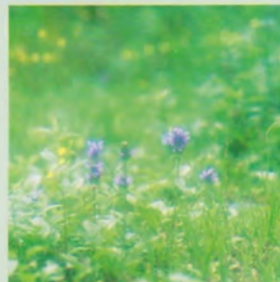
▲緑豊かなで気分爽快です。