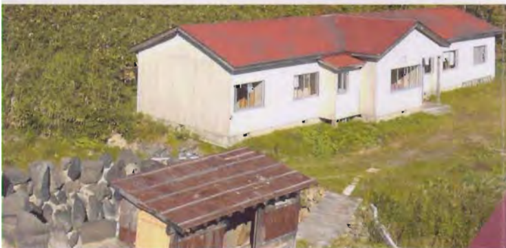
混浴露天風呂と自炊部「国見荘」