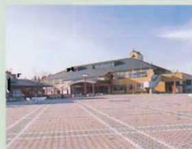
▲盛岡手づくり村(車で40分)

12月~4月まで休業しております。冬期間のお問い合わせは下記までご連絡下さい。☎(0196)92-3355