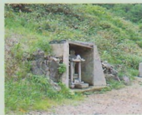
▲薬師如来(当館の守り本尊)