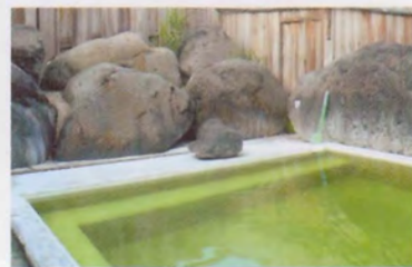
女性専用露天風呂