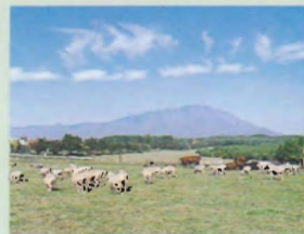
▲小岩井農場(車で40分)