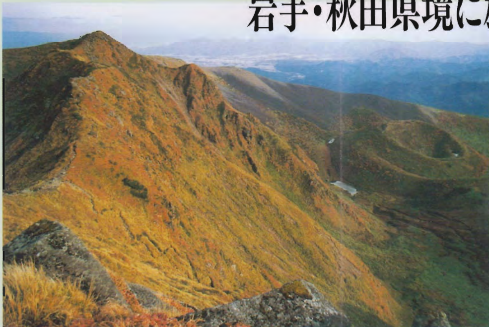
▲駒ヶ岳／高山植物の宝庫、登山客の目を楽しませます。